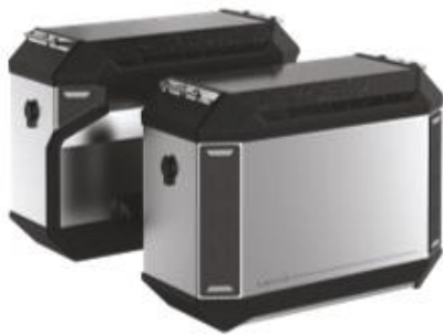
Aero Aluminum ADV