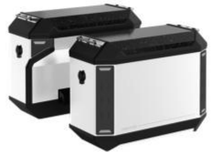
Cool White ADV